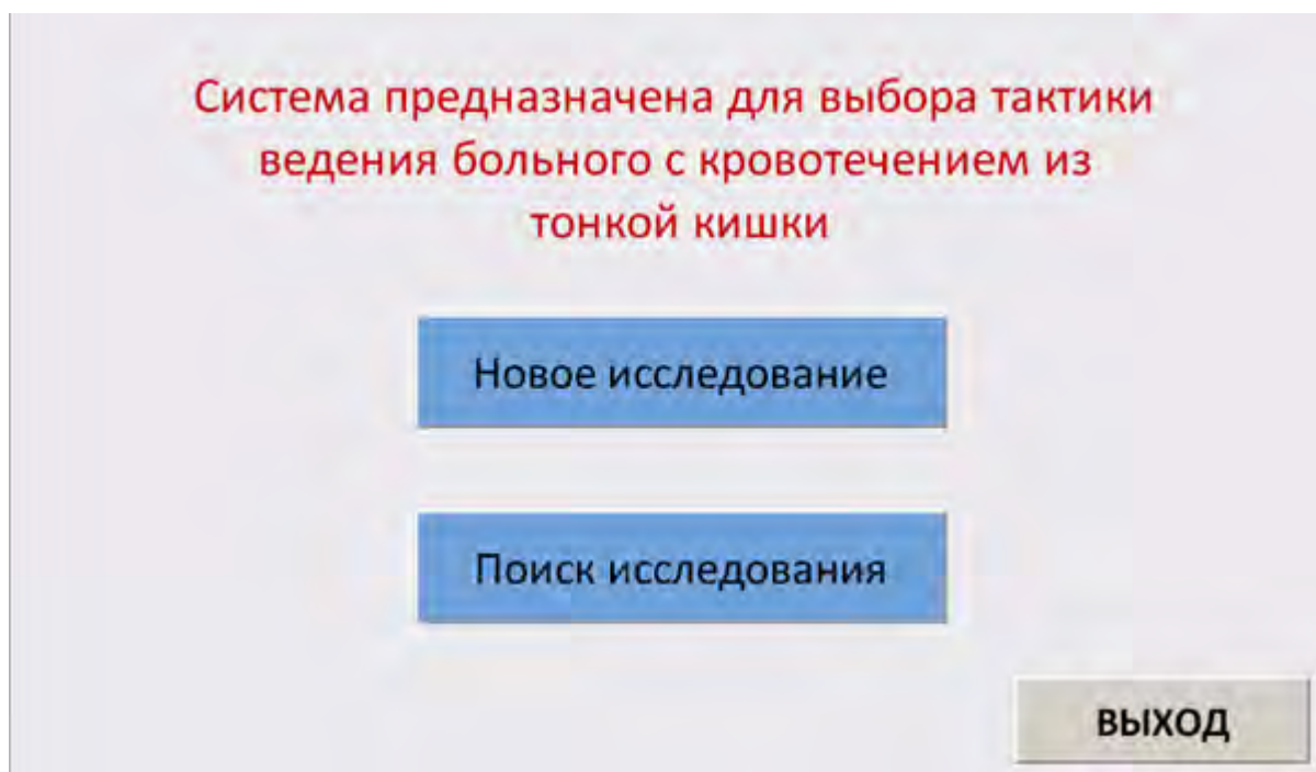
Рисунок 2. Загрузочная форма автоматизированной системы