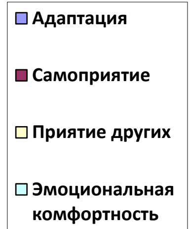
Рисунок 3. Показатели социально-психологической адаптации