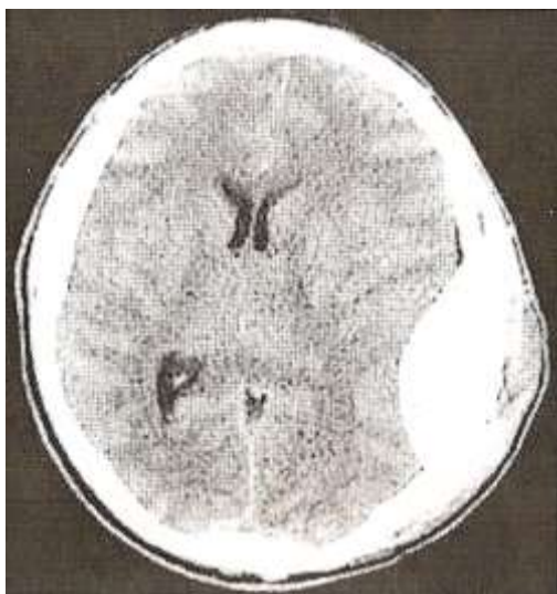
Рис. 1. КТ головного мозга, больной Р., 49 лет.