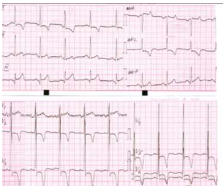
Рис. 1. ЭКГ больного X, 27 лет.

Лабораторные данные: эритроциты - 5.84 \times 10^{12}/л , гемоглобин - 153 г/л, лейкоциты - 8.2 \times 10^9/л : эозинофилы – 1%, палочкоядерные – 4%, сегментоядерные – 56%, лимфоциты – 35%, моноциты – 4%; тромбоциты – 136 \times 10^9/л , СОЭ- 4 мм/час. Общий анализ мочи без патологии. Биохимический анализ крови: общий белок – 65. Билирубин общий - 16.5 мкмоль/л. Билирубин прямой - 4.8 мкмоль/л. Мочевина - 6.5 ммоль/л, Креатинин – 72 мкмоль/л. АЛТ – 54 ед/л, АСТ – 34 ед/л, глюкоза- 6.2 ммоль/л, КФК общ – 59 ед/л, КФК МБ - 15.4 ед/л, натрий – 142 ммоль/л, калий - 4.72 ммоль/л, хлориды – 107 ммоль/л.