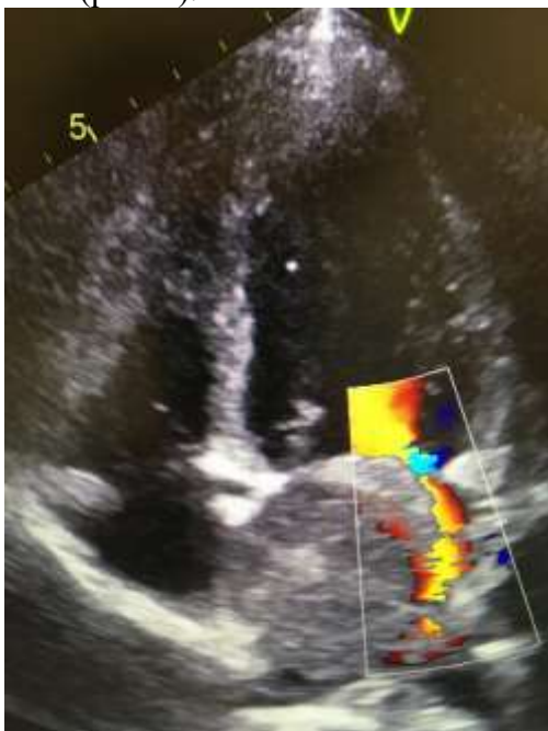
Рис. 1. ЭхоКГ пациентки 55 лет

При ЭхоКГ сердца в полости левого предсердия обнаружено огромное округлое образование 4,0х4,1 см, вызывающее обструкцию левого атриовентрикулярного отверстия (рис. 1).