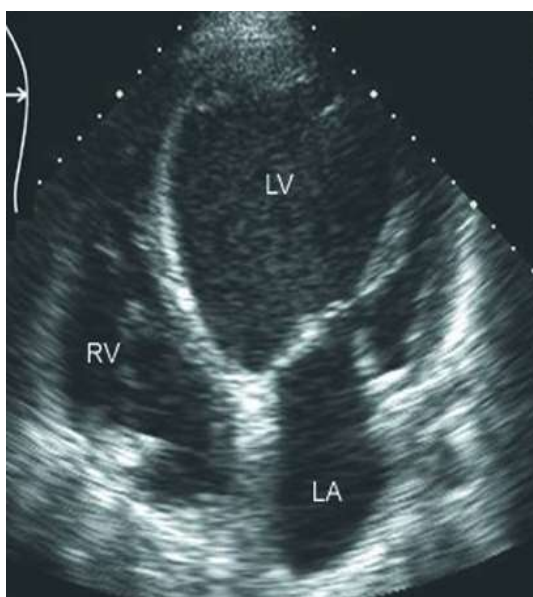
Рис. 2. ЭхоКГ пациента Н, 46 лет.