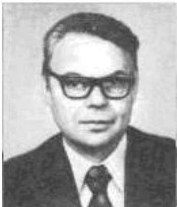
Академик Ю. Е. Вельтищев