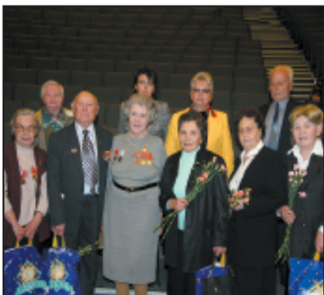
Встречи с ветеранами проходят в Университете весной