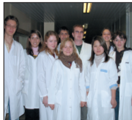
236 группа успешно сдала зачеты и экзамены