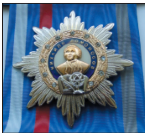
В октябре РГМУ награжден орденом Ломоносова