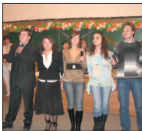
Сотрудники и студенты Университета - участники конкурсов самодеятельности