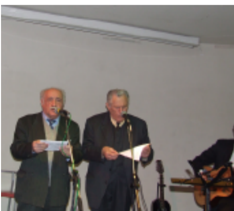
«Учитель наш 2-й Медицинститут»