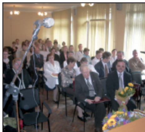
Весь год в Университете проходят встречи и конференции. На снимке — юбилей в Измайловской детской больнице