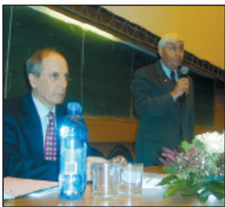
День науки — праздник РГМУ. Традиция, которой в этом году исполнится 60 лет