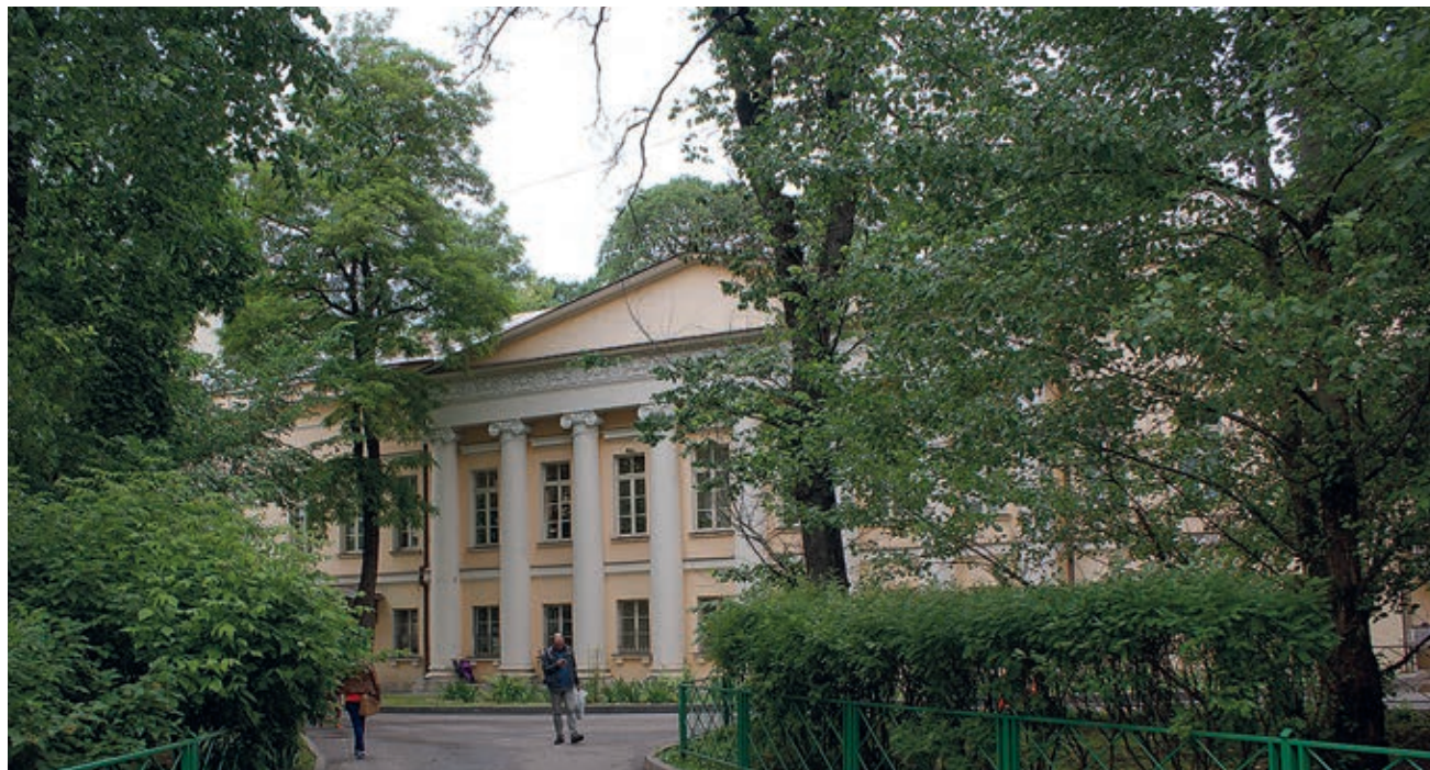
ДГКБ №13 им. Н.Ф. Филатова