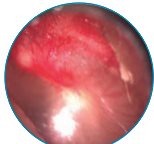
Отоскопическая картина острого, среднего, катарального отита