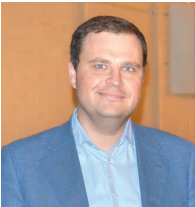
Доктор медицинских наук, доцент