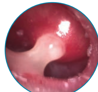
Отоскопическая картина острого, среднего, гнойного отита