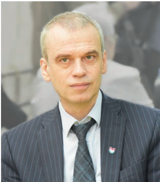
Академик РАН, доктор биологических наук

открытия был разработан целый ряд новых молекулярно-генетических методов, которые широко используются в молекулярной биологии и генной инженерии.